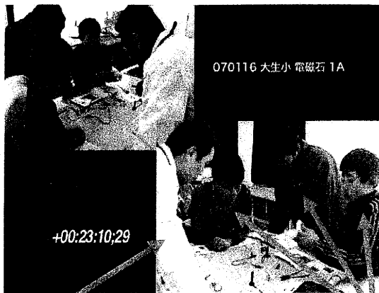
教師が誰に何を指導しているか観察する

基本は少人数のグループ活動方式、2～3人1組で話し合いながら分析する。また、活動の状況を見て、インストラクターがアドバイスや問いかけをしながら進めていく。