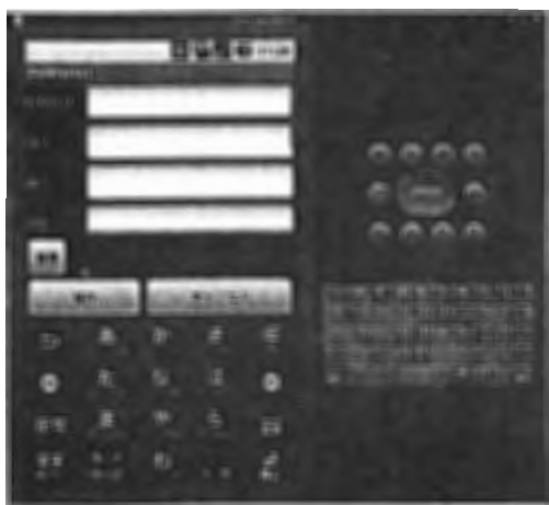
図 6 エミュレータでの入力画面

下の画像は、試作した電子野帳の入力画面を表示したもので、左下は入力画面。右下は、入力終了した状態。これに新規作成用の画面を作成し、ボタンの機能を付加すればよい。