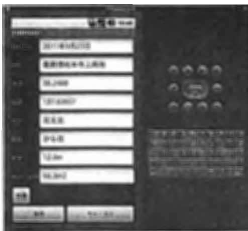
図 7 エミュレータでの入力例