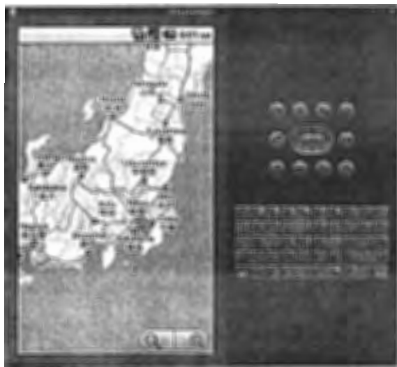
図 5 エミュレータでの地図表示

下の画像は、試作した電子野帳の入力画面を表示したもので、左下は入力画面。右下は、入力終了した状態。これに新規作成用の画面を作成し、ボタンの機能を付加すればよい。