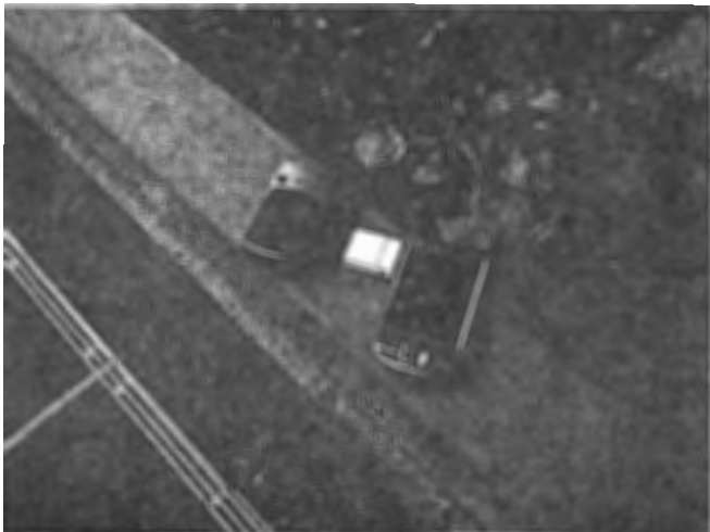
図2 愛宕山での測位比較実験

実験では、iPAQ のスロットにメモ리카ード型受信機を差し込むが、差し込んでもソフトが立ち上がりず、差し込みを繰り返すことがあった。また、「みちびき」からの受信がうまくいかず、GPS からの信号のみで測位することがあった。