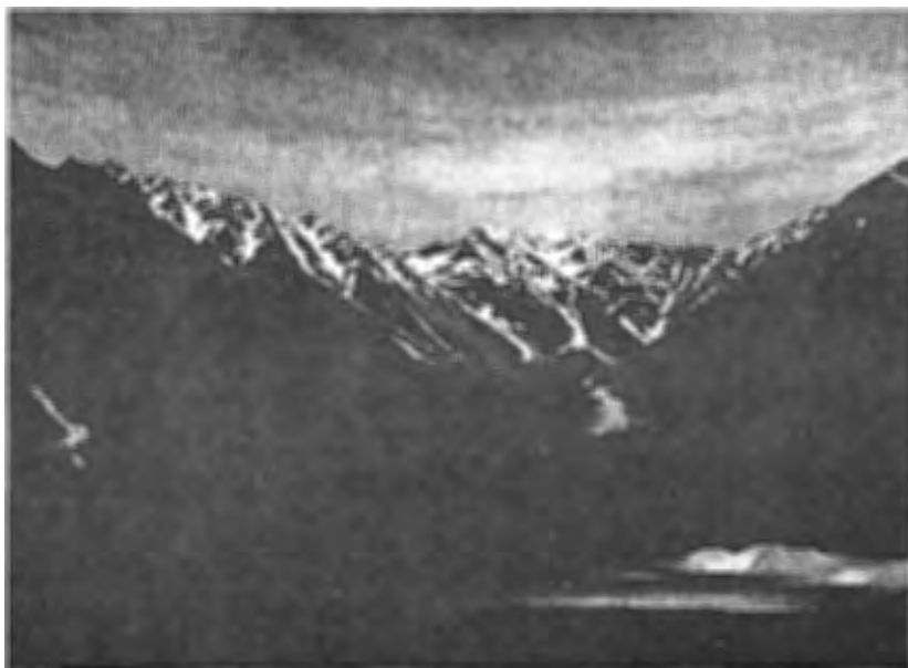
図1 ALOS データから作成した3D画像（上高地）