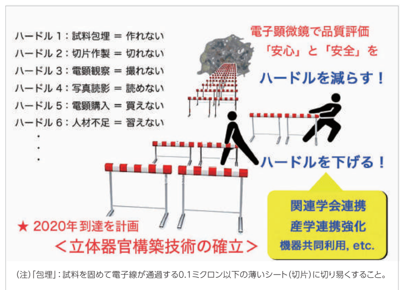
図3 急速に高まる電子顕微鏡解析のニーズに備えて

においてもAI(=人工知能)技術の応用が期待されており、電子顕微鏡を開発・生産する企業と大学/研究機関、関連学会等が中長期的なビジョンを共有し、産学連携を強化した研究開発が待望されます。